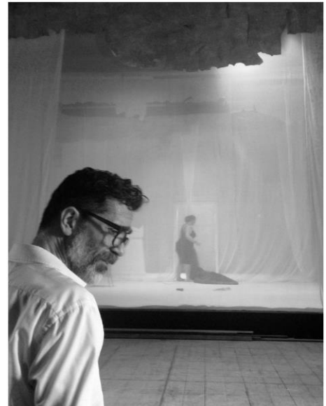
Romeo Castellucci, πρόβες της παράστασης Ορέστεια (μία οργανική κωμωδία;), 2015