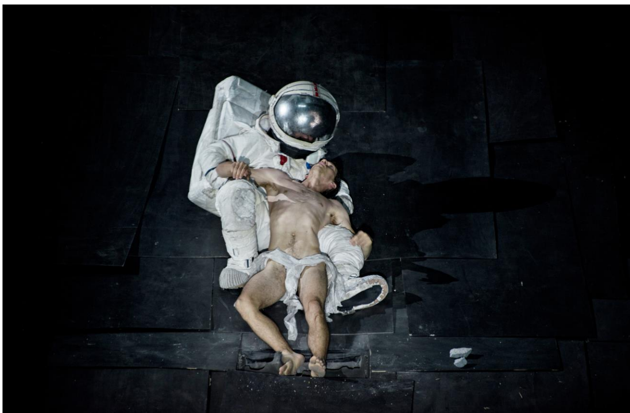
Σκηνή από την παράσταση Ο μέγας δαμαστής [The Great Tamer], σκηνοθεσία: Δημήτρης Παπαϊωάννου, ©Julian Mommert, 2018.

Ειδικότερα, η γενετική ανάλυση αφορά στη μελέτη όλων των σταδίων της διαδικασίας της δημιουργίας, από τη σύλληψη μέχρι τη σκηνική ολοκλήρωσή της. Εστιάζει στη βαθμιαία πραγμάτωση της δραματικής και σκηνικής σύνθεσης, την εργασία των δημιουργών πάνω στο δραματουργικό υλικό, την ανίχνευση και κατανόηση του θεωρητικού υποβάθρου του καλλιτεχνικού στοχασμού, των πηγών και των αναφορών των δημιουργών, τη μελέτη της διαδικασίας των δοκιμών, τη διδασκαλία και καθοδήγηση των ερμηνευτών, τη διαχείριση του χώρου, των κοστούμιών, του φωτισμού, της παραγωγής κ.ά.