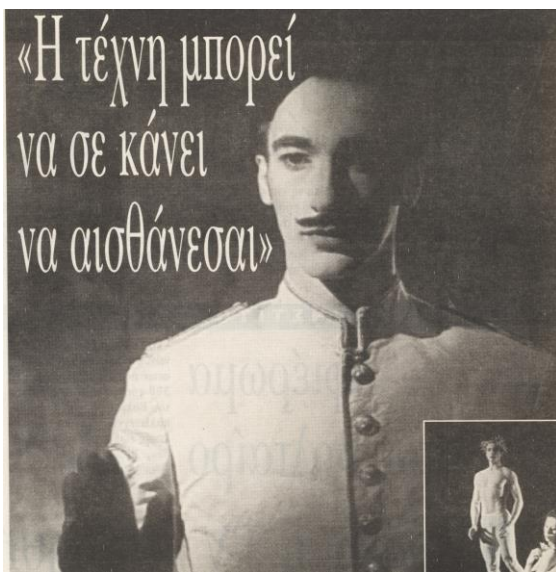
01. Απόκομμα Τύπου από συνέντευξη του Δημήτρη Παπαϊωάννου. Εφημερίδα Το Κέρδος, 15.01.1994.

Ένα νέο έργο με τίτλο «Αρχείο Δημήτρη Παπαϊωάννου: Τεκμηρίωση, Ψηφιοποίηση, Καινοτόμες Εφαρμογές Έρευνας και Προβολής» [KA 80556] έχει εκκινήσει από τον Ιανουάριο 2021. Αφορά στο πεδίο της ψηφιακής πολιτιστικής κληρονομιάς και τεκμηρίωσης του σύγχρονου πολιτιστικού αποθέματος και έχει ως ειδικότερο αντικείμενο την επεξεργασία, τεκμηρίωση, ψηφιοποίηση και προβολή του αρχείου και του καλλιτεχνικού έργου του διεθνούς ακτινοβολίας σκηνοθέτη, χορογράφου και εικαστικού, Δημήτρη Παπαϊωάννου. [εικόνα 01]