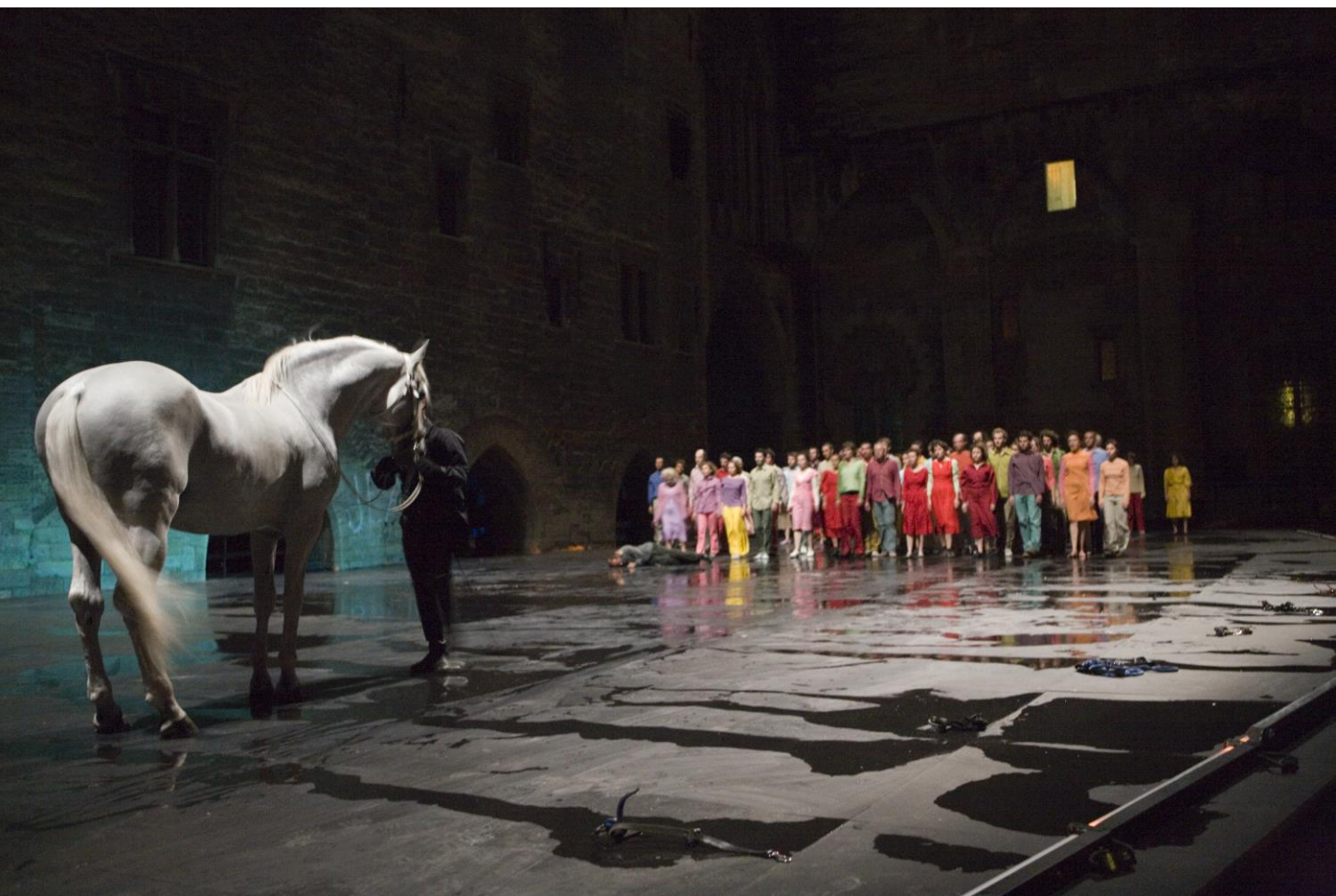
05. Σκηνή από την παράσταση Κόλαση σε σκηνοθεσία του Romeo Castellucci, Αβινιόν, 2008.